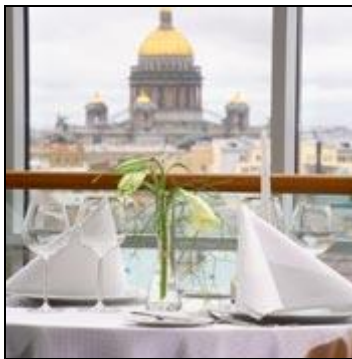
Morgenmad på hotellet

Efter en tredive minutters kørsel fra St. Petersburg, ankommer vi midt i et eventyr, den russiske landsby Shuvalovka. Vi vil besøge de traditionelle udflytterhuse og lære traditionel russisk håndværk. Vi vil også smage på forskellige slags for "Ratafia" - en krydret vodka trukket på forskellige bær, krydret med krydderurter fra Oldrussiske opskrifter.